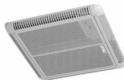
Mod. 60 empotrar y superficie